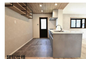
類似仕様 キッチン