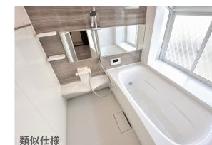
類似仕様 バス/シャワー