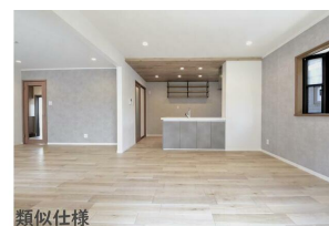
類似仕様 リビング