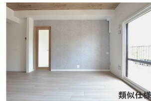
リビング 類似仕様