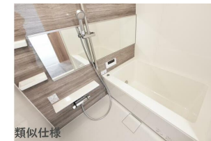
バス/シャワー 類似仕様