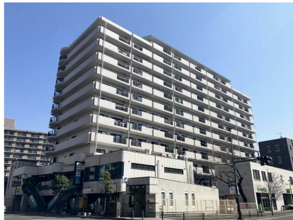
※今、室内リノベーション中。2026年7月2日に完工予定。

販売物件は、厳正な物件調査を行い、良質な物件のみを自社で購入してリノベーションを行なっています。