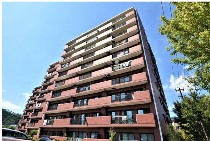
タイル張りのオシャレな外観♪

販売物件は、厳正な物件調査を行い、良質な物件のみを自社で購入してリノベーションを行なっています。